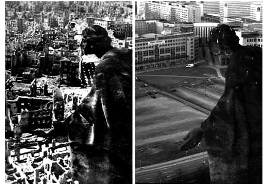
Blick vom Rathausturm in Dresden 1945 und heute. Hinten rechts diagonal verläuft die Prager Straße. 1