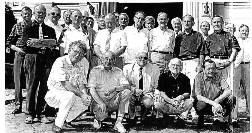
Zweites Klassentreffen der A 1941 im August 1995 vor dem Schultor St. Afras.

Alle Materialien unserer Klassen, d. h. Fotos, Rundbriefe, handschriftliche Auf-zeichnungen, Presseberichte usw. werden dem Stadtarchiv Meißen übergeben, das an den Unterlagen bereits Interesse gezeigt hat, um seine Sachgruppe „Fürstenschule“ zu ergänzen. Aufgrund gesetzlicher Regelungen wird das kommunale Archiv von einer Fachkraft des Archivwesens geleitet. Es bietet Ge-währ für eine sorgfältige Aufbewahrung und Aufbereitung der Unterlagen.